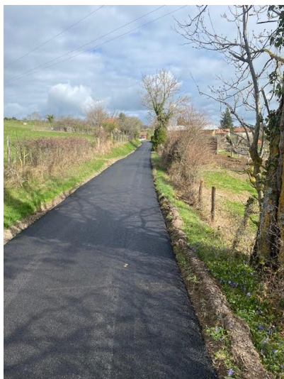
Réfection du chemin des Gouttes, (financement avec l'enveloppe de voirie communale