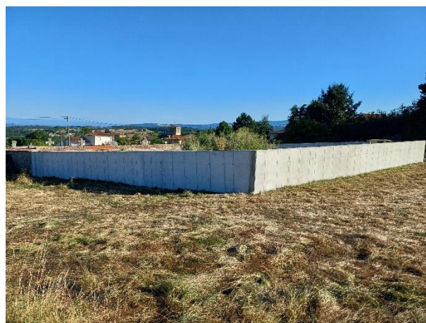
Mur terminé, avant terrassement intérieur (août 2024)