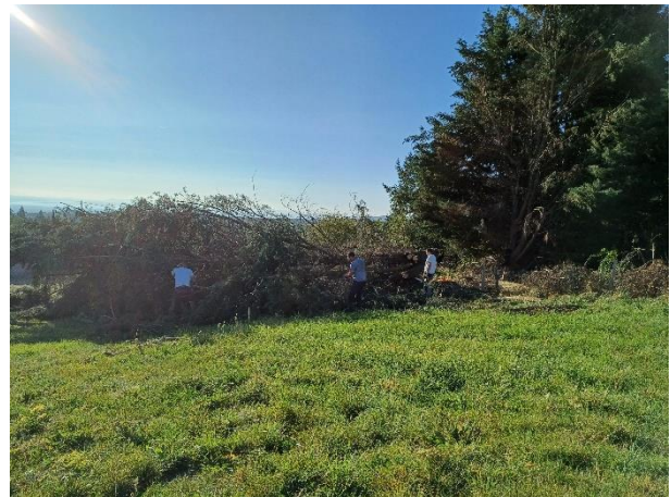
Abattage des arbres (octobre 2023 – merci aux bénévoles !)