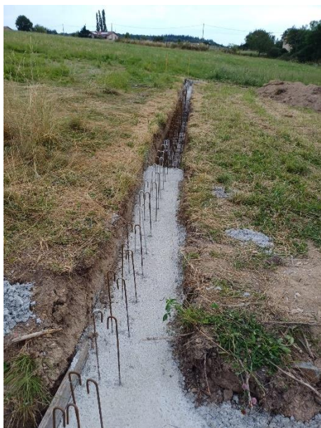
Fouilles du mur (juillet 2024)