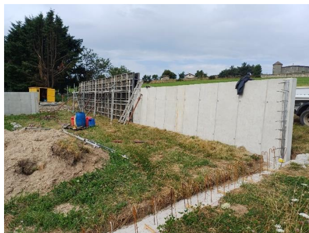
Mur en construction (juillet 2024)