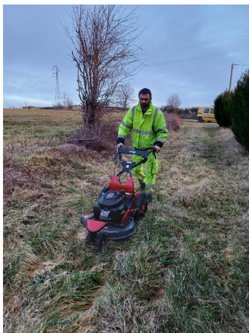
Nouvel équipement pour notre agent : une tondeuse débrousaileuse