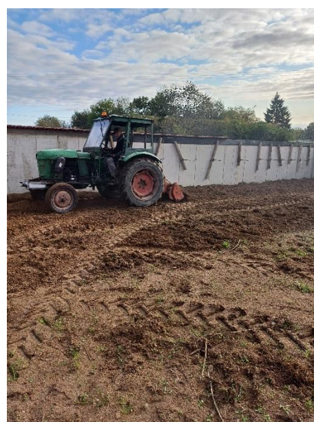
Préparation du terrain... (octobre 2024)