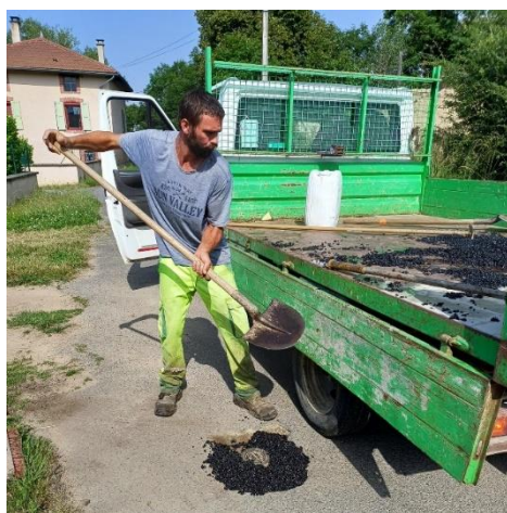
Travaux de voirie sur les chemins communaux