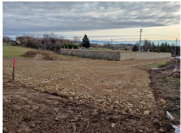
Terrassement (mars 2024)