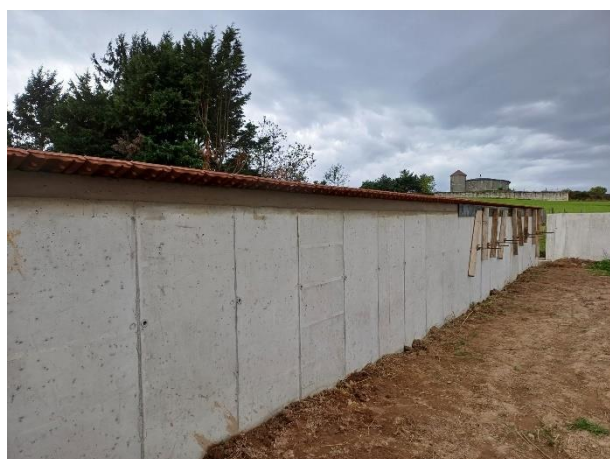
Pose des tuiles (octobre 2024)