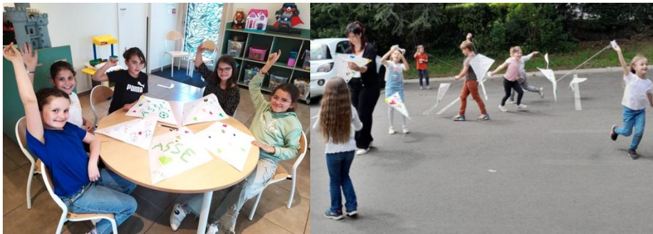
Sortie au Musée d'Art et d'Industrie à Saint-Etienne, avec notamment un atelier de confection de cerfs-volants... suivi de la mise en pratique !