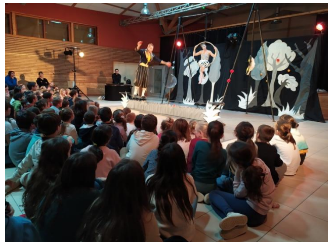
Spectacle Kipouni's à Saint-Martin, auquel les résidents de la Marpa assistent également