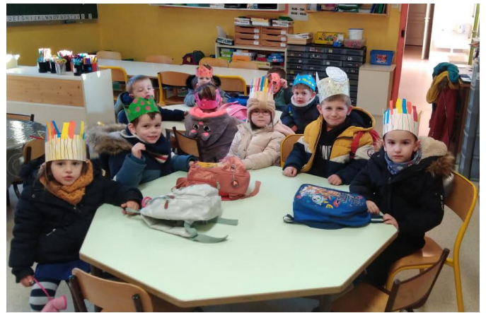
Dégustation de la galette des rois... avec des couronnes faites maison !