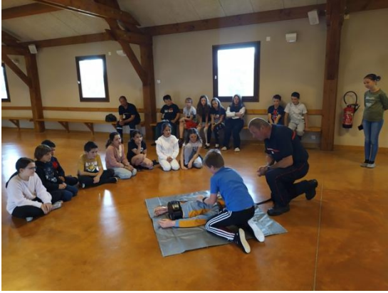
Formation aux premiers secours pour les élèves d'Ailleux Un grand merci aux pompiers de Saint-Martin !