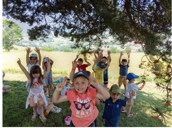
Certains jours, pour les élèves de Saint-Martin, petit-déjeuner partagé (préparé par les parents) puis la classe est faite dehors !