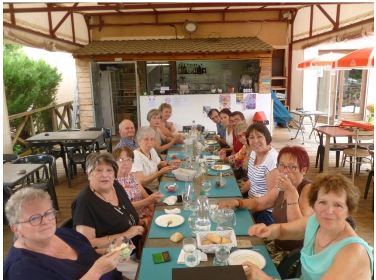
Sortie restaurant et croisière en péniche à Briennon en juin 2025

Enfin, « cerise sur la gâteau », le groupe sophro s'accorde chaque année une petite excursion et deux sorties au restaurant. Les effets bénéfiques de ces activités complémentaires ne sont plus à prouver !