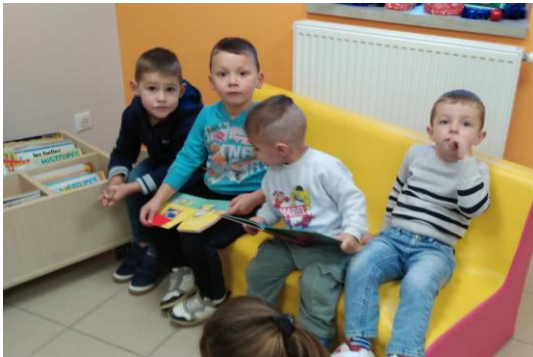
Moment studieux à la bibliothèque à Saint-Martin