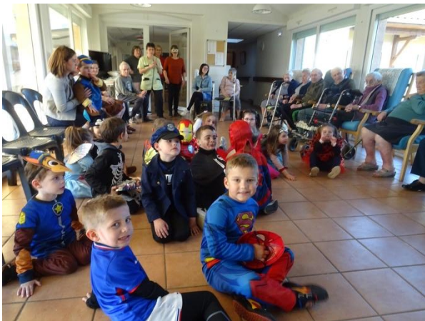
Les plus beaux déguisements sont de sortie pour fêter carnaval avec les résidents de la Marpa à Saint-Martin